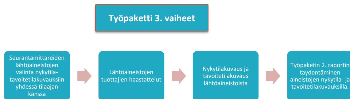
Kuva 3. Työpaketti 3. vaiheet.

Lopputuotoksena konsultti täydentää työpaketin 2. raporttia sekä taulukkomuotoista seurantamittareista aineistojen nykytila – ja tavoitetilakuvausten edellä kuvatuilla sisällöillä.