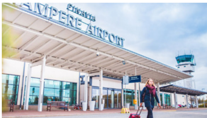
Lentoliikenteen kehitys Tampereen seudulla näyttää myönteiseltä.

Sen sijaan suurten kaupunkiseutujen asema ei ole hallitusohjelman kautta vahvistunut. MAL-sopimusmenettely on laajentunut ja kattaa nyt neljän suuren kaupunkiseudun lisäksi kolme pienempää kaupunkiseutua.