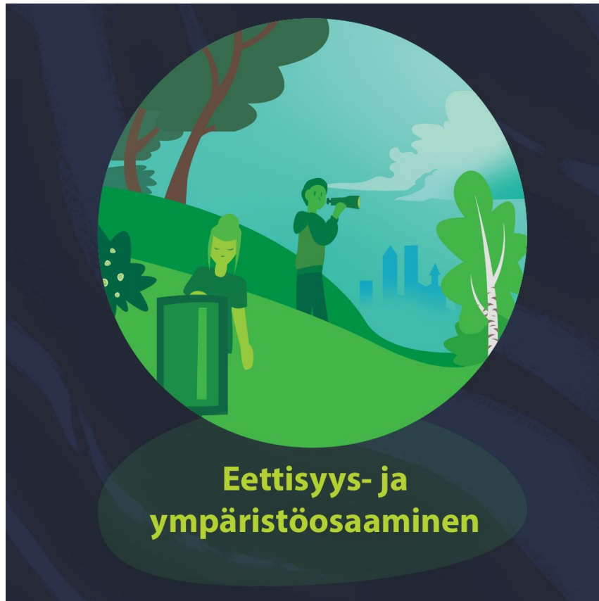
Kuva Hilla Lehtola (Tammerkosken lukio sarjasta Laaja-alainen osaaminen lukiossa 2024)

Päällikön ensisijainen tehtävä on seurata Tampereen kaupunkiseudun Tiekartan 2024+ ja seudullisten laatukriteerien toteutumista sekä yhdessä seutukunnan lukioiden kanssa suunnitella valitut kehittämiskohteet tuleville aikajaksoille.