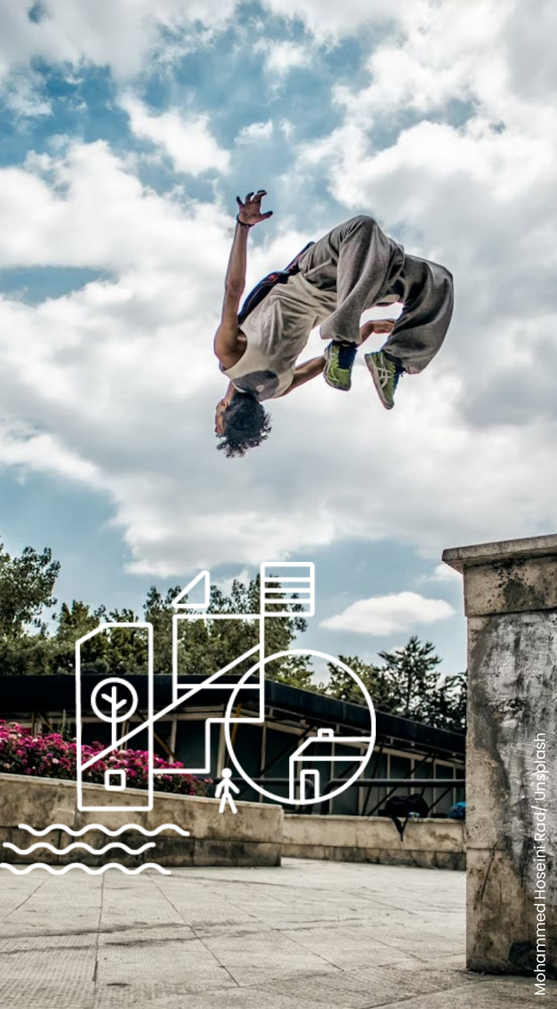
Mohammed Hoseini Raaf, Unsplash